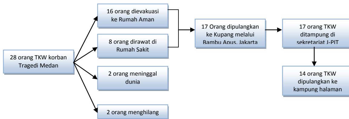
Peraga 1. Alur Penanganan TKW korban Tragedi Medan 1

Alasan ketiadaan biaya Pemprov dikritisi dengan keras oleh anggota DPRD Provinsi NTT, Alex Kase, yang mengatakan bahwa alasan tersebut sangat tidak tepat mengingat kondisi para TKW yang begitu memprihatinkan. Pemprov dinilai seharusnya benar-benar bertanggungjawab dalam hal ini. Hal kedua yang memunculkan penilaian bahwa Pemprov tidak siap, adalah bahwa sebelumnya Pemprov NTT melalui Dinas Sosial telah merencanakan untuk menampung para TKW di Dinas Sosial (No 19). Namun pada waktu para TKW korban tragedi Medan ini tiba di Kupang, mereka tidak dibawa ke penampungan milik Dinas Sosial melainkan ditampung di sekretariat Jaringan Perempuan Indonesia Timur (J-PIT) di Lasiana (No 24).